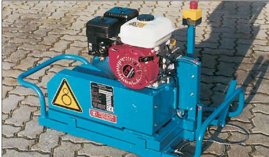
KE-500 mit Benzinmotor / KE-500 with petrol engine