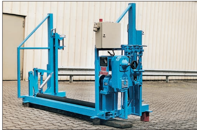
Kabelknecht mit Antrieb