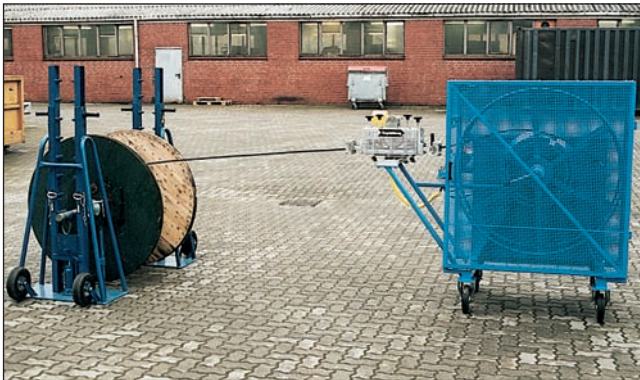
Abbildung: Ringwickler in Kombination mit Hebebock Picture above: Cable Coiler in combination with drum trestle